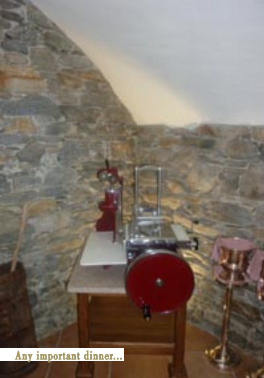
Any important dinner...