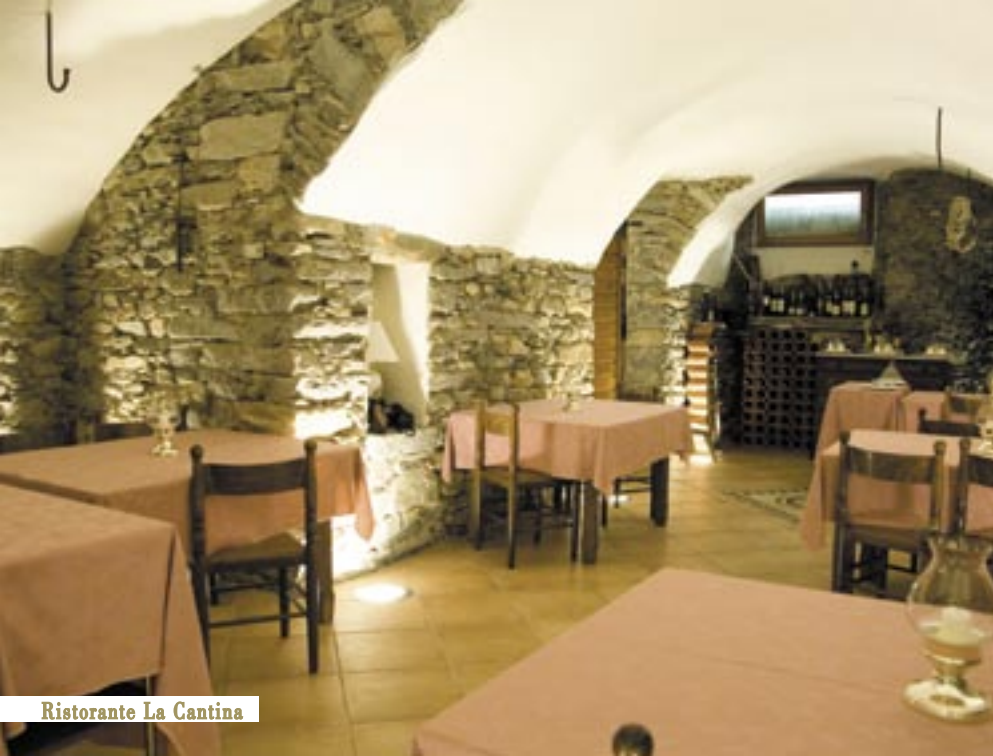
Ristorante La Cantina